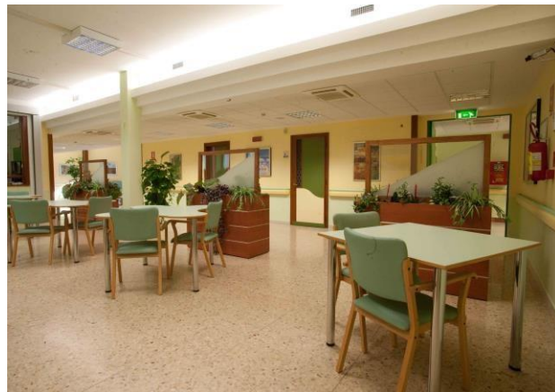
Sala da pranzo degenti