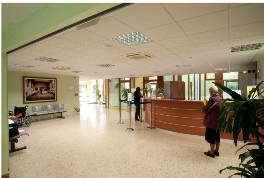
(Accettazioni e Segreterie)

Navigando le varie sezioni del sito WWW.CENTRORIABILITATIVOVERONESE.IT gli utenti possono prendere visione dei documenti di sistema pubblicati, scaricare modulistica di interesse e conoscere il CRV nel dettaglio delle sue attività