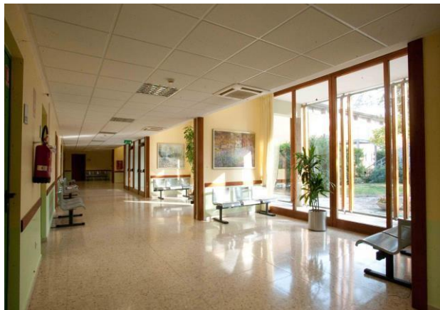
Sala di attesa